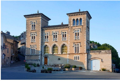
Maison qui a précédé le château actuel